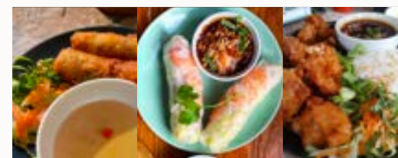
Frühlingsrolle Sommerrolle Knusper Huhn

Sommerrollen, 2 Stück + Garnele & Schwein 7 € + Tofu & Gemüse ✓ mit Erdnuss Sauce* 6,50 €